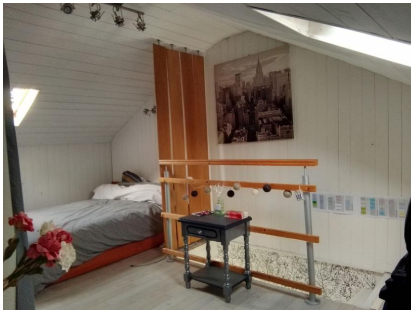
Abbildung 4 Nach Wochen des Frierens - endlich eine geheizte Unterkunft bei einer sehr herzlichen Gastfamilie