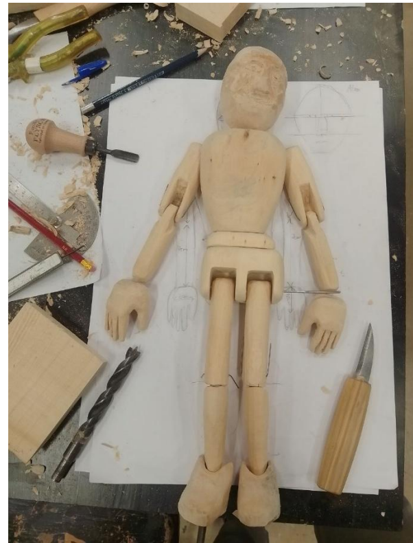
Abbildung 8 Mein Highlight - Schnitzen von Fadenmarionetten