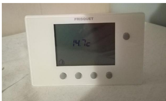
Abbildung 2 Leider kein Witz - 14,7 Grad und ich ziehe die Reißleine

Die meisten Studenten der ESNAM leben in Jahrgangs-WGs in großen Wohnungen oder sogar Häusern. Ich hatte schon im Vorfeld Kontakt mit einer der Studenten aufgenommen und konnte in ein freies Zimmer in ihrer WG in der Innenstadt ziehen. Miete mit knapp 400 Euro nicht gerade billig für ein winziges Zimmerchen mit geringem Tageslichteinfall. Außer mir lebten in der WG 4 weitere Studenten der ESNAM. Ich fühlte mich dort nicht wohl und