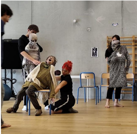
Abbildung 7 Gruppenübung; hier wird viel gelacht, doch der Schein trügt - niemandem kann man trauen