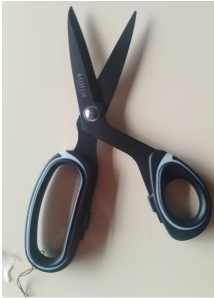
Abbildung 11 Corpus Delicti - die von mir vollkommen zerstörte Stoffschere

professionell bleiben. Und natürlich auch, weil ich die Wurzel des Mobbings in privaten Kontext der WG vermutete und erst nach und nach erkannte, dass es auch an den strukturellen Gegebenheiten des Jahrgangs lag.