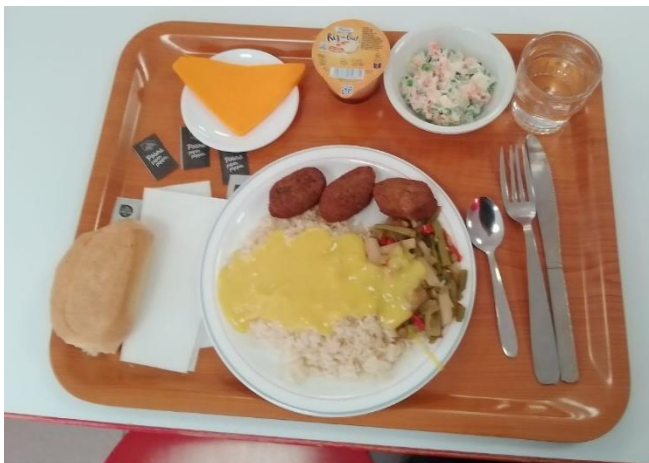
Abbildung 6 Es wird gegessen was auf den Tisch - ein typisches Menü aus der Mensa

Von 13:00 bis 14:15 gibt es eine Mittagspause. Etwa die Hälfte der Studenten sucht dafür eine nahe gelegene Kantine des französischen Studentenwerkes „Crous“ auf. Ein Mittagessen kostet dort 3,30 € und ist damit teurer als unsere Mensa in Berlin; das Menü beinhaltet dafür aber neben dem Hauptgericht auch immer eine kleine Vorspeise, eine kleine Nachspeise, sowie ein Molkereiprodukt samt Weizenbrötchen.