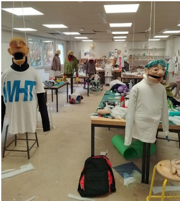
Abbildung 9 Momentaufnahme aus der Puppenwerkstatt - Kaum zu glauben, dass Menschen die so schöne Puppen herstellen, so böse sein können